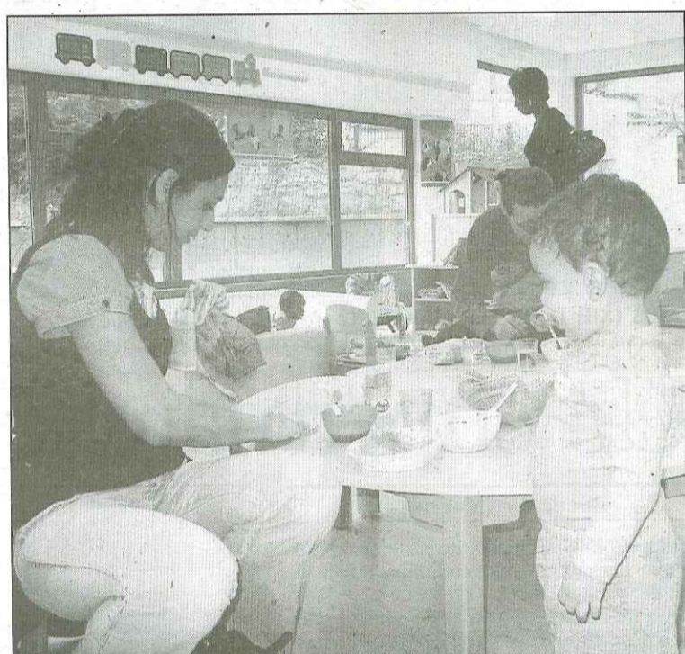
IVRY, HIER. Une crèche interentreprises a été inaugurée dans le quartier d'Ivry-Port. Quarante enfants y sont accueillis de 7 h 30 à 20 heures.